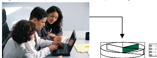
SMS respons målinger

Alle indkomne SMS beskeder tikker direkte ind i en database. Derved kan du følge aktiviteterne time for time, minut for minut og spare tid på administrativ optælling mv.