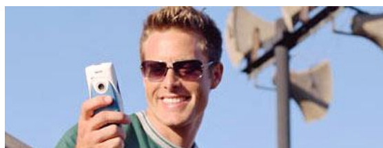
Reserver materiale og billetter på SMS

*Der debiteres for min. 99 udgående SMS enheder per md. Indgående SMS'er afregnes direkte via brugerens eksisterende mobilabonnement.